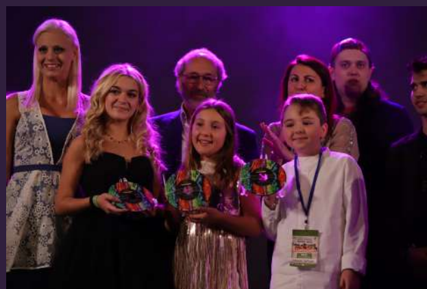
I tre premiati della Finale Junior e Baby