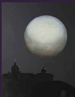
Roma e la luna