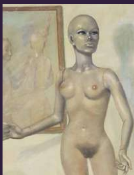
Il pittore e la modella