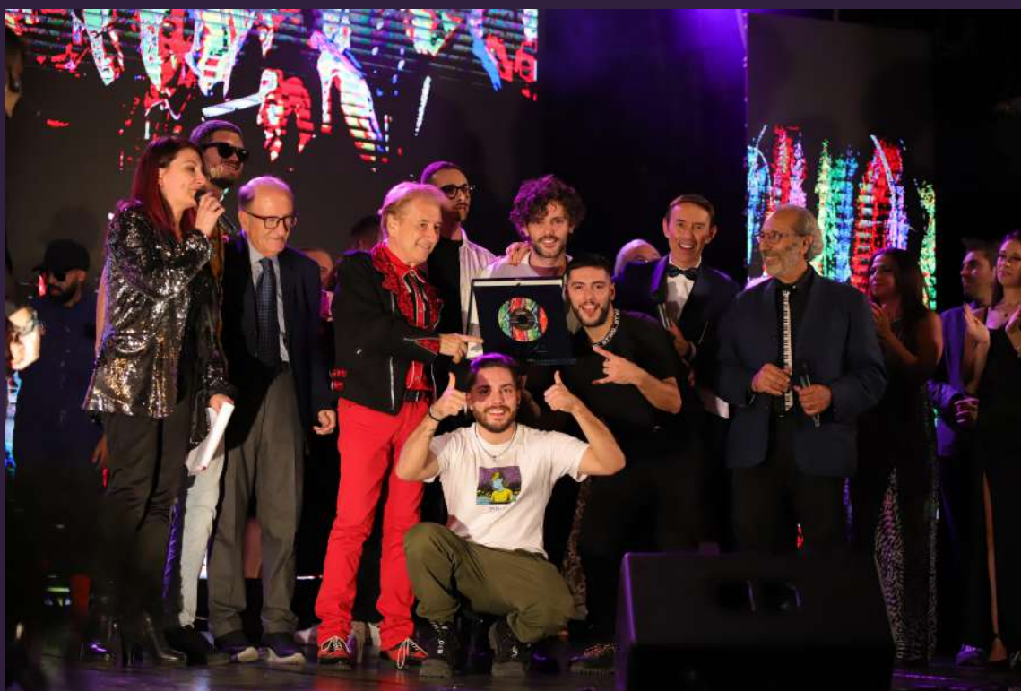
La band XGlove con il brano Satelliti - Vincitrice dell'edizione 2022

Dal reality alla realtà non è solo uno slogan ma una vera e propria filosofia operativa. Il panorama musicale è ormai molto collegato ai vari talent che vengono costantemente proposti in TV e Il Cantagiro si presenta come alternativa a questo sistema. Il Cantagiro è un concorso "reale", i concorrenti si sfidano in giro per l'Italia a colpi di musica davanti un pubblico vero! Il Tour 2023 avrà il Patrocinio di UNICEF Italia e di SIAE. Il Concorso si articola in circa 80 Selezioni provinciali e Finali Regionali che si svolgono in tutta Italia; nelle Pre-Semifinali e Semifinali Nazionali con 300 giovani cantanti in gara; nelle Pre-Finali con 40 semifinalisti; per concludersi con la Finalissima dove tra 20 finalisti verranno premiati il Vincitore assoluto e i Vincitori delle varie Categorie con ulteriori premi e menzioni speciali.