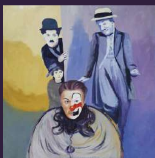
Omaggio a Fellini e Charlie Chaplin